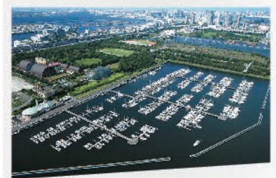
マリンメーカーの展示・試乗会を通年開催