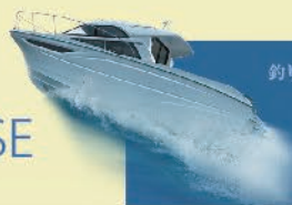
シミュレーション艇