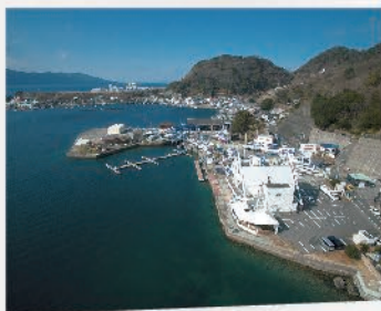
全国でも有数の景勝の地・天然の良港とされる内浦湾に面しており、波も穏やか