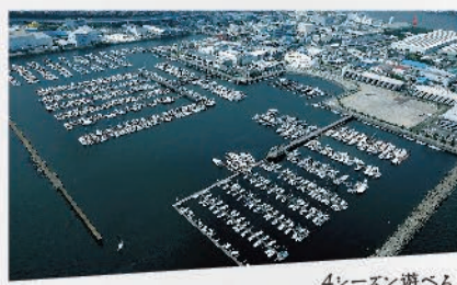
4シーズン遊べる 世界中の海から多くの人々が寄港するシティ・マリナー