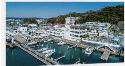
本格マリンスポーツを楽しめる環境を完備