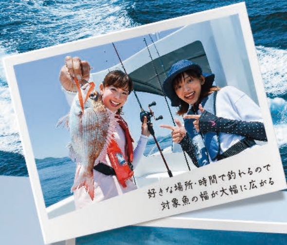
好きな場所・時間で釣るので 対象魚の幅が大幅に広がる