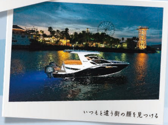
いつもと違う街の顔を見つける