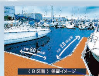
〈B区画〉係留イメージ