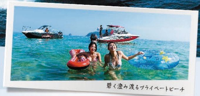
碧く澄み渡るプライベートビーチ