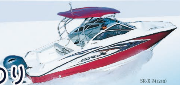
SR-X 24 (24ft)

〈お支払い例〉クレジット 60回 + ボーナス払い 20万円 = 月々 9.2 万円